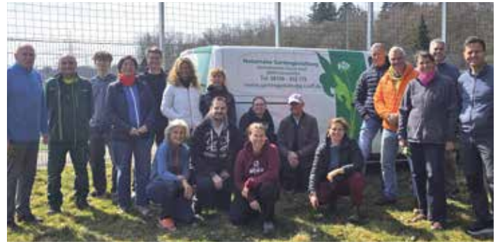
SCBV-SAISONAUFTAKT AM 1. MAI