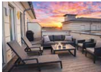
Penthouse direkt am Baldhamer Marktplatz