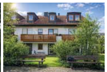
2-Zi.-Wohnung mit Balkon in Kirchtrudering