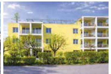
2-Zi.-Wohnung mit Loggia in Zorneding