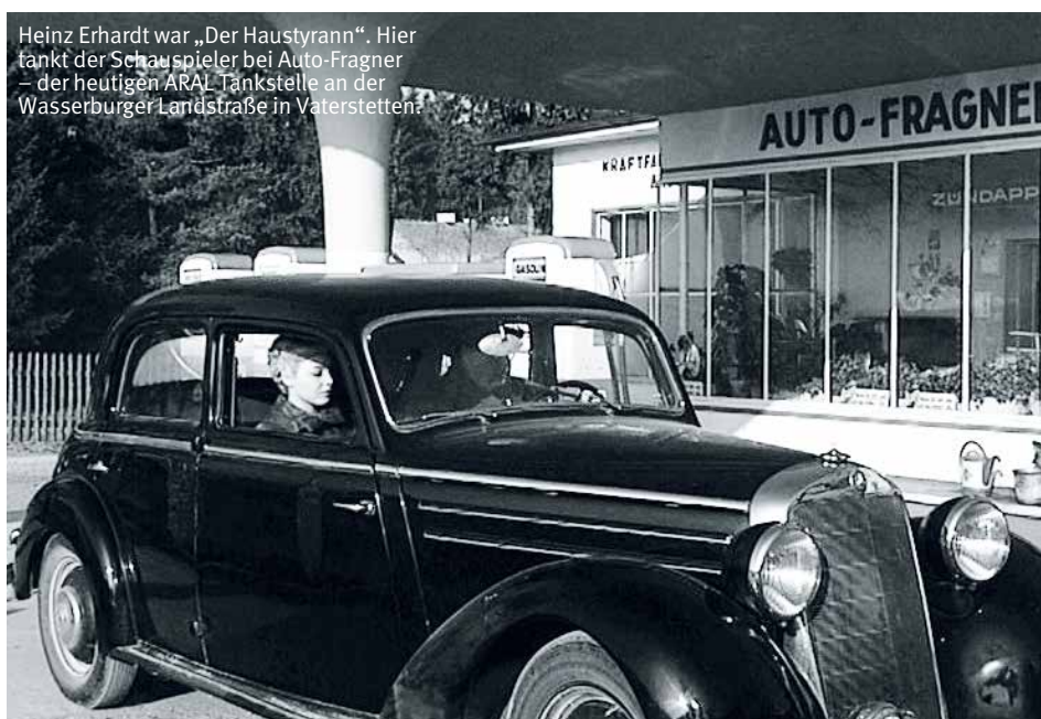
Heinz Erhardt war „Der Haustyran“. Hier tankt der Schauspieler bei Auto-Fragner – der heutigen ARAL Tankstelle an der Wasserburger Landstraße in Vaterstetten.