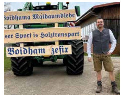
MAIBAUM FRAGEN AN DEN VORSTAND DER FEUERWEHR BALDHAM