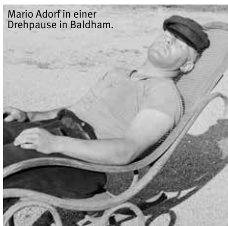
Mario Adorf in einer Drehpause in Baldham.

Adorf thematisierte die Dreharbeiten in Baldham auch in seiner Autobiographie „Himmel und Erde: Unordentliche Erinne-