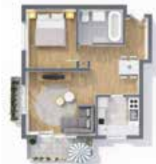
2-Zi.-Wohnung mit Balkon in Trudering