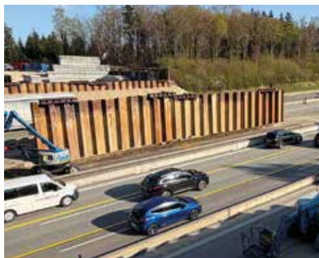
B304/A99 AN ZWEI WOCHENENDEN KOMMT DIE BEHELFSBRÜCKE