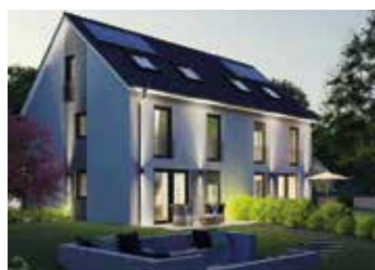
Neubau-DHH und EFH in Zorneding