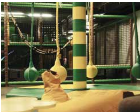
FUNKY MONKEY NACH WENIGEN WOCHEN IST SCHON WIEDER SCHLUSS