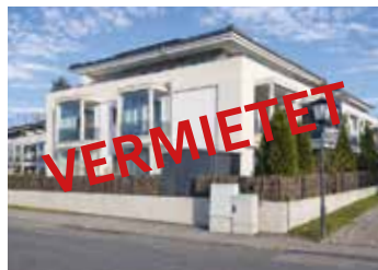
Exklusives Penthouse in Zorneding