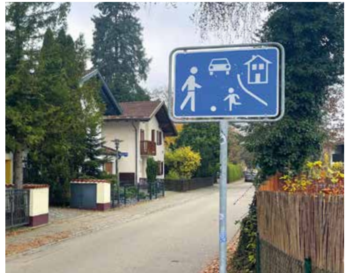
ZEICHEN 325.1: HÄTTEN SIE'S NOCH GEWUSST