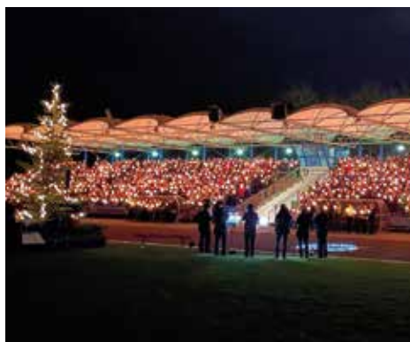
WEIHNACHTSZEIT Alle Veranstaltungen auf einen Blick