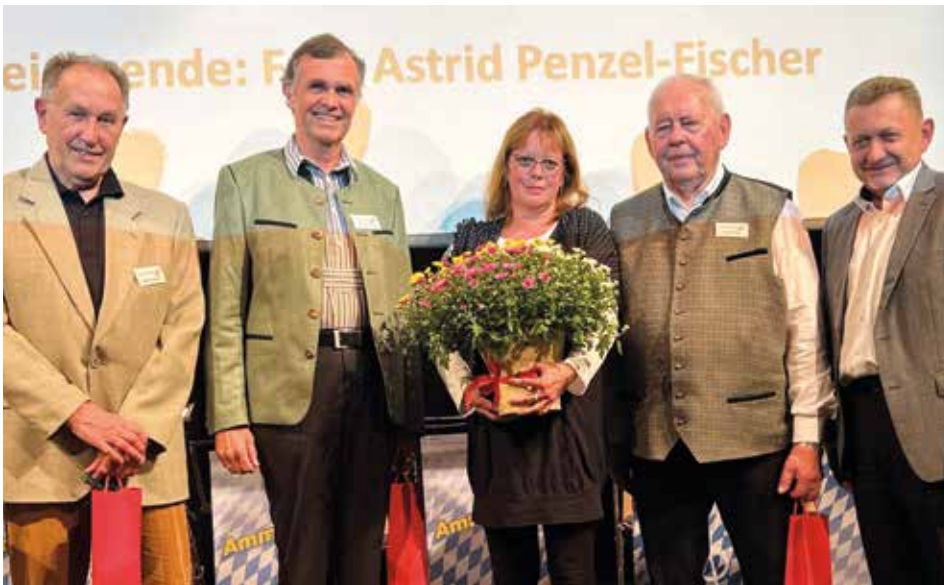
NBH-MITGLIEDERVERSAMMLUNG IM JUBILÄUMSJAHR