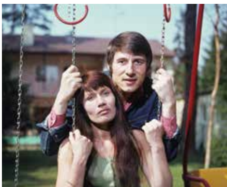
10. TODESTAG Udo Jürgens' Jahre in Vaterstetten